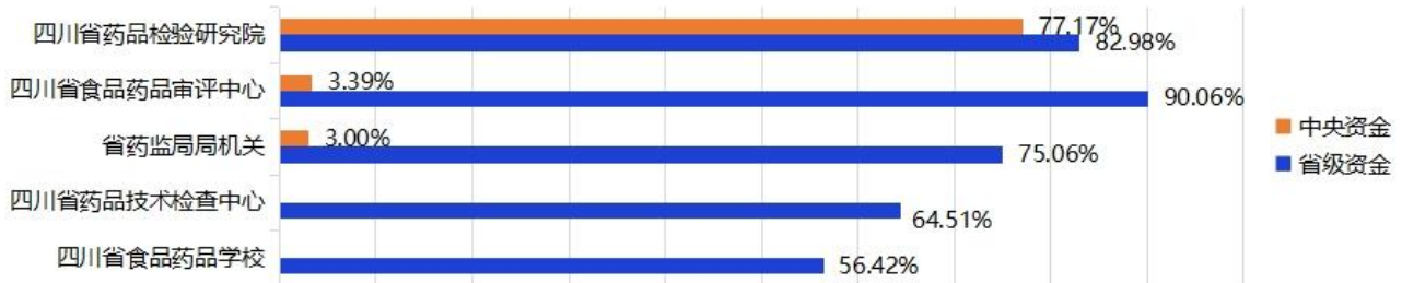
图 1 省本级各直属单位 2021 年中央和省级药品监管补助资金执行进度柱状图

年 3 月 31 日，省本级中央药品监管资金执行数为 1,697.04 万元，执行进度 72.65%；省级药品监管资金执行数为 7,781.37 万元，执行进度 77.19%；省本级各直属单位详细执行进度见下图。